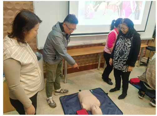
中正區健康中心老師講解