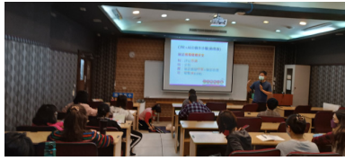
中正區健康中心老師講解